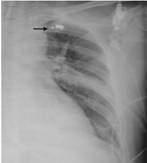
Figura 1. Radiografía de tórax con presencia de bala con esquirlas en la región anatómica de la desembocadura del conducto torácico (flecha).

esófago, aorta, tumores del mediastino y disecciones radicales de cuello. Entre 0.2 y 3 % se debe a traumatismos penetrantes o cerrados de tórax después de un accidente. 3,4 En ocasiones puede ser idiopático. Puede complicarse con insuficiencia respiratoria, desnutrición por pérdida proteica e infecciones por pérdida de inmunoglobulinas y linfocitos. 5,6